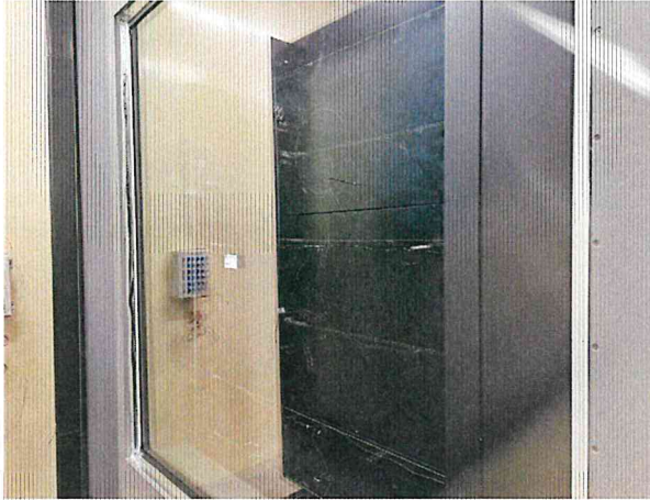
단열성 - 저온실측 사진