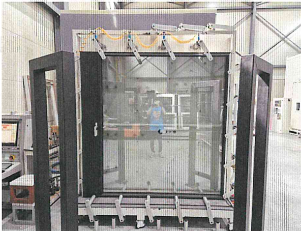
기밀성 - 정면 사진