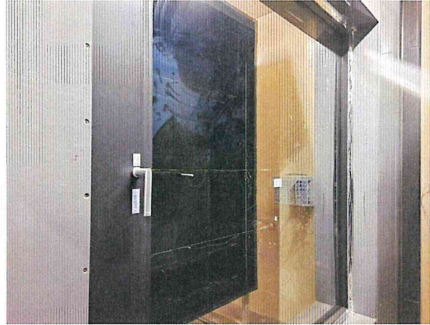
단열성 - 항온실측 사진