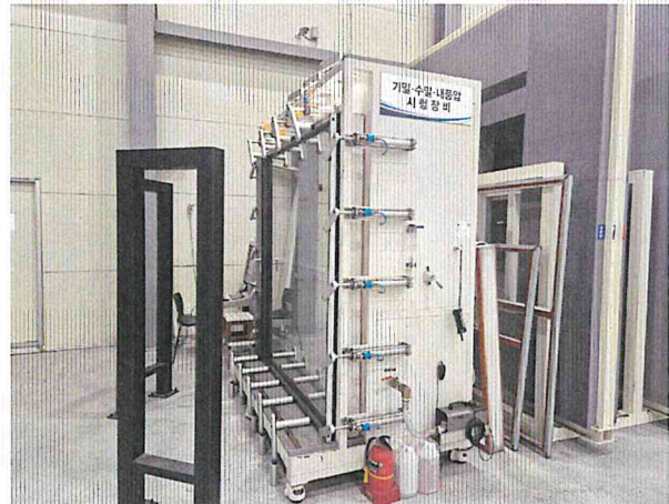
기밀성 - 측면 사진